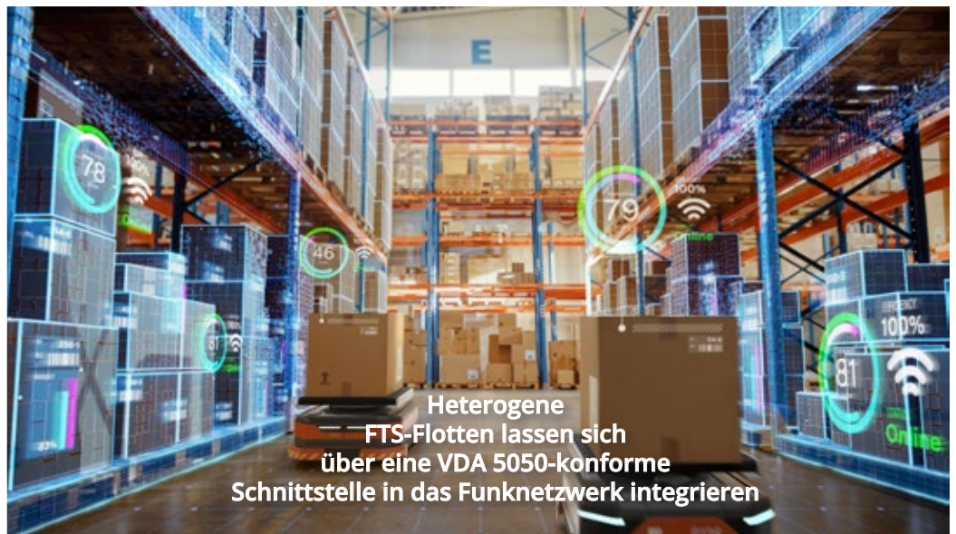
Heterogene FTS-Flotten lassen sich über eine VDA 5050-konforme Schnittstelle in das Funknetzwerk integrieren

ist das Ziel der Optimierung bei vielen Modernisierungsprojekten in der Intralogistik. Und es bietet auch eine erhebliche Verbesserung gegenüber der bisherigen Art der Informationsgewinnung für diese Zwecke. Sie bestand darin, dass die FTS auf ihren Wegen durch die Produktion z. B. freie Palettenstellplätze erkannten und diese Information weitergaben. Oft waren diese Plätze aber schon wieder besetzt, wenn Minuten später ein FTS eine Palette eben dort absetzen wollte. Mit dem Funknetzwerk passiert das nicht: Es liefert Echtzeit-Informationen, auf die das in der Nähe befindliche FTS sofort reagieren kann.