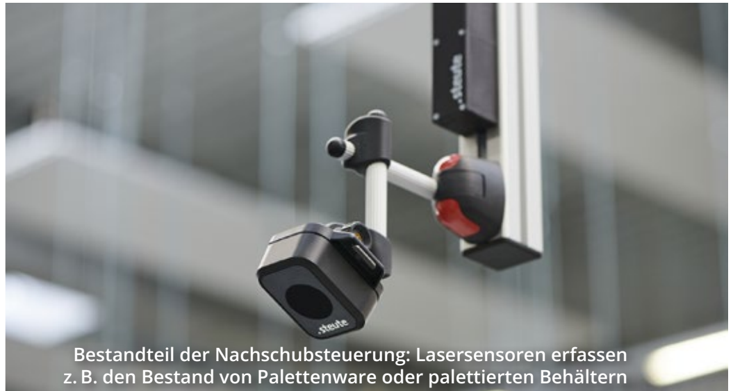
Bestandteil der Nachschubsteuerung: Lasersensoren erfassen z. B. den Bestand von Palettenware oder palettierten Behältern